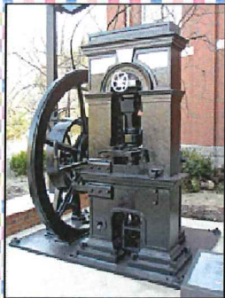
香港から輸入した「圧印機」