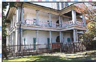
泉布観(大阪現存最古の洋風建築 旧造幣寮のゲストハウス)