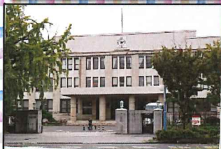
大阪造幣局 正門/本局