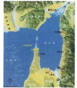
約5500年前頃の大阪平野北部の様子

私たちが生活する大阪平野はどのようにしてでき、どのような地質からできているのでしょうか？ここでは、大阪平野とその周辺の地形の成り立ちや地形を構成する地質について、第四紀と呼ばれる地質時代の気候や環境などとともに解説します。