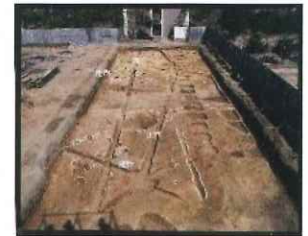
1985年の経済学部棟の調査

山之内遺跡は杉本キャンパスを含み、西隣の遠里小野遺跡と一体となって広大な遺跡群を形成しています。発掘調査により、旧石器時代以後、各時代の遺跡が発見されています。古墳時代から奈良時代を中心に、海と陸に開かれた住吉南部の古代史を語ります。