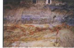
大阪市立自然史博物館地下の上町層

大阪公立大学杉本キャンパスや大阪市立自然史博物館が立地する上町台地南部の地質の特徴やなりたちを、地質調査データやボーリングデータをもとに作成した地質断面図を用いて紹介します。